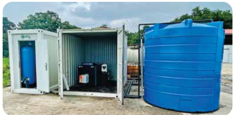
Image non contractuelle - container et cuve de stockage non fournis